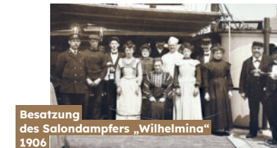
Besatzung des Salondampfers „Wilhelmina“ 1906

Heute arbeiten mehr und mehr Frauen auf Rheinschiffen, doch noch immer bleibt die Branche vorrangig „Männersache“. Dabei haben Frauen eine lange aktive Rolle in der Arbeitswelt der Binnenschifffahrt.